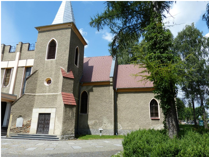
Fot. 1 Okna w ścianie południowej.