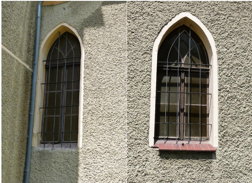
Fot. 2 Okna w ścianie południowej.